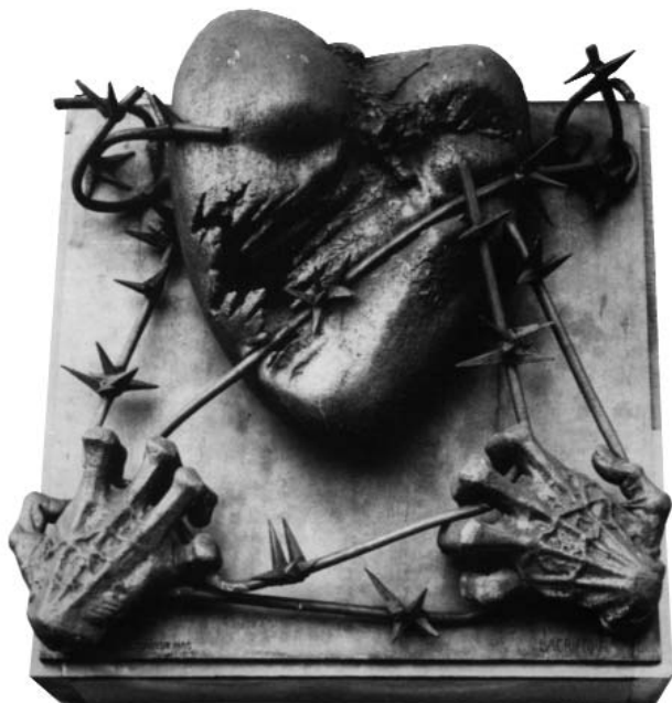
L'un des seize hauts-reliefs en bronze du Mémorial du Mont Valérien (Lieu des martyrs de la Résistance et Mémorial de la France Combattante)