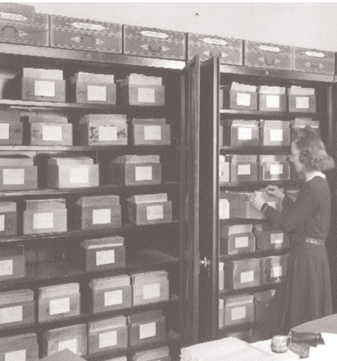
Des services de Police, sous l'autorité de la Gestapo, sont chargés d'établir des listes et de poursuivre les maçons. Sur le document une fonctionnaire du Service des Sociétés Secrètes installé au 16, rue Cadet.