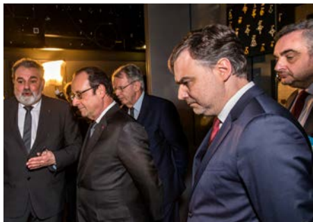
Visite de François HOLLANDE, Président de la République au Musée de la Franc-Maçonnerie le 27 février 2017

Le Grand Orient de France fonctionne sur un modèle démocratique. Ses loges sont souveraines. Les différentes fonctions (Grand Maître, Conseillers de l'Ordre, Présidents des loges...) sont toutes électives et encadrées sur le plan du cumul, du renouvellement et de la durée. Les loges sont représentées à l'Assemblée générale (le Convent) selon le principe « une loge, une voix ».