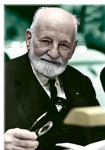
René Samuel CASSIN

à l'occasion du 60 ème anniversaire de la Déclaration Universelle des Droits de l'Homme