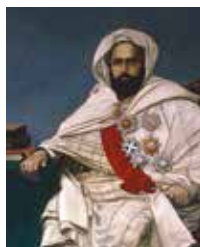
Emir ABD EL-KADER