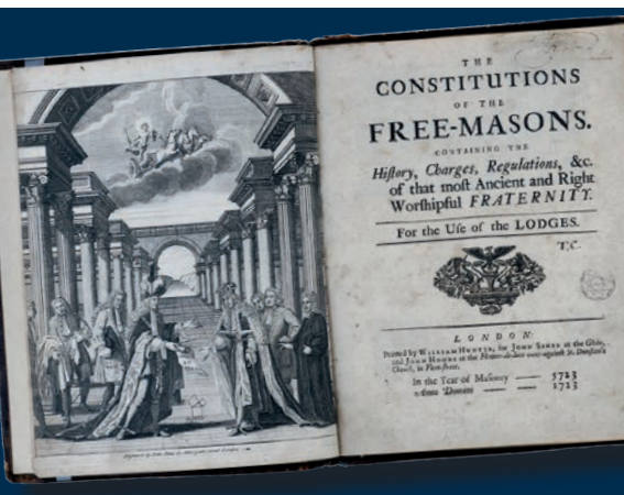
Originalausgabe der Konstitutionen von Anderson (1723)

„Sich selbst hinterfragen, von anderen und ihrer Andersartigkeit in einem kollektiven republikanischen Ideal lernen.“