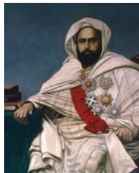
Emir ABD EL-KADER