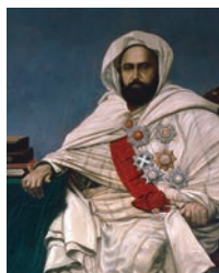
Emir ABD EL-KADER